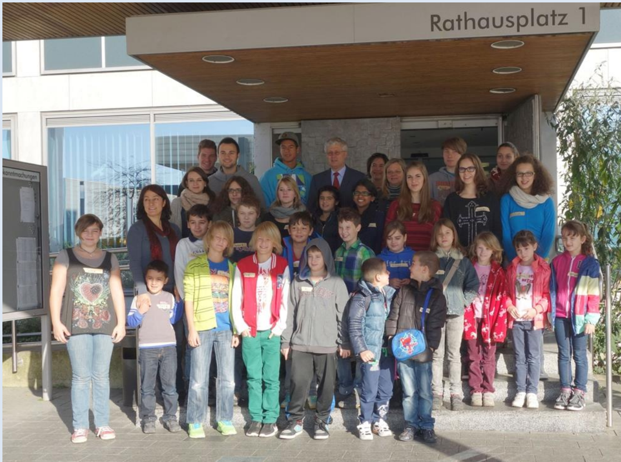
first expedition through the city