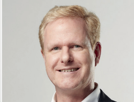
Holger Hebisch Wärmenetze