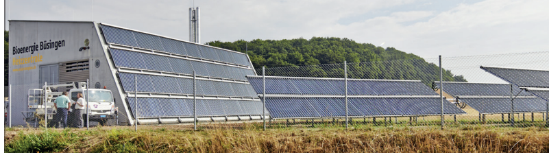
Gutes Beispiel: In Bisingen am Hochrhein speisen eine Holzhackschnittelheizung sowie eine solarthermische Freilandanlage in ein Wärmenetz ein.

Als Energieversorgungstechnik können heute KWK-Anlagen wie effiziente Blockheizkraftwerke (BHKW), Groß-Wärmepumpen oder Holzhackschnittelheizungen, am besten in Kombination mit Freiflächen-Solarthermie zum Einsatz kommen.